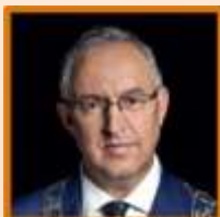
Burgemeester A. Aboutaleb, Voorzitter Coördinerend bestuurder

Zes leden uit het Algemeen Bestuur vormen het Dagelijks Bestuur. Het Dagelijks Bestuur is belast met de voorbereiding en uitvoering van de besluiten die het Algemeen Bestuur neemt. Ieder lid van het Dagelijks Bestuur heeft zijn / haar eigen portefeuille. Hieronder is een overzicht van het Dagelijks Bestuur opgenomen.